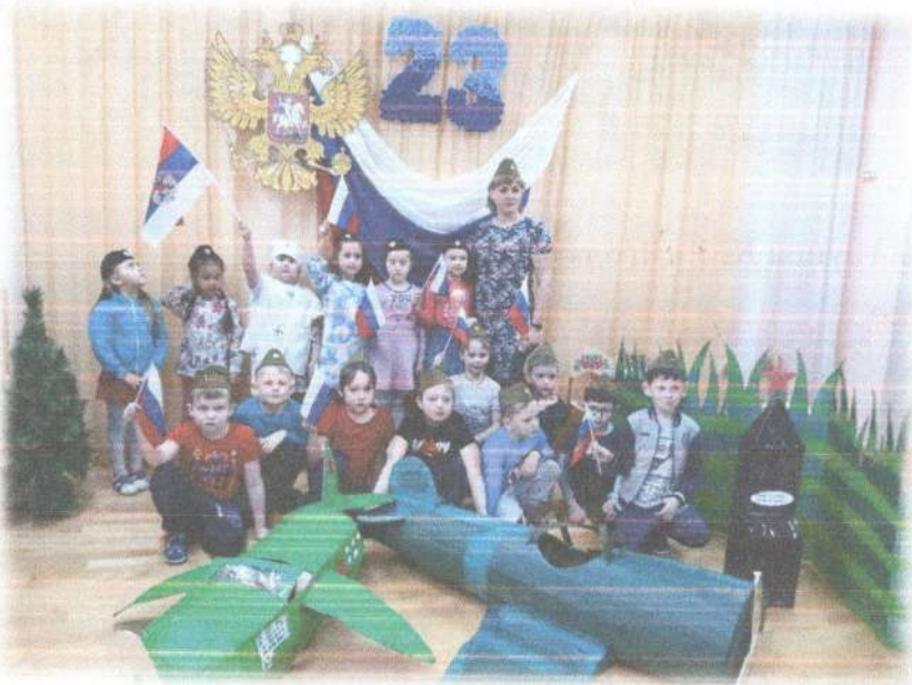
Старшая группа № 9 «Звездочки»